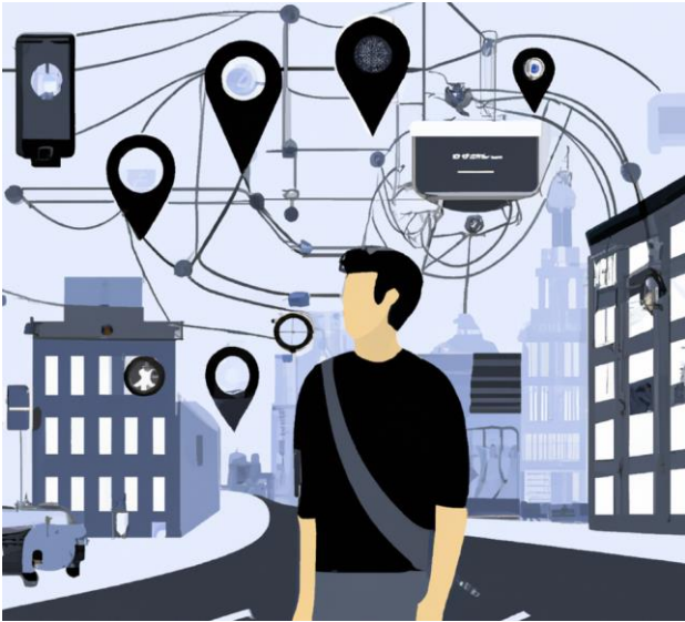
Illustration AI-genererad Bild med verktyget DALL-E. ("Människa i stad med uppkopplad information och platser, kartor och GPS")